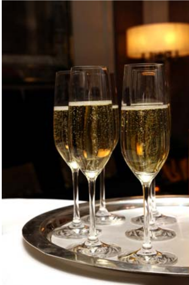
Empfang im Opera Court