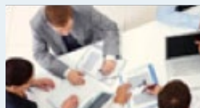
Umfragen & Ask anything Session