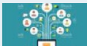
Call for papers

Möchten Sie am Programm oder als Aussteller mitwirken?