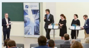
Keynote-Vorträge und Diskussionsrunde