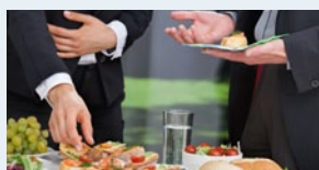
Empfang am Abend